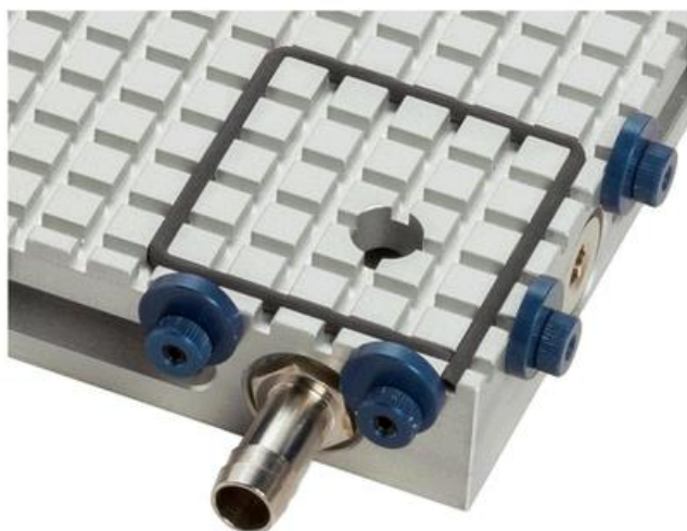
Fixação com cordão de vácuo